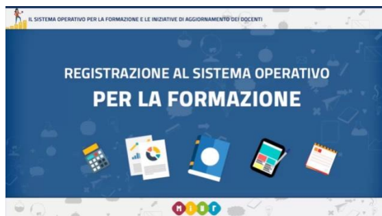
S.O.F.I.A.: RegISTRAZIONI docenti – tutorial